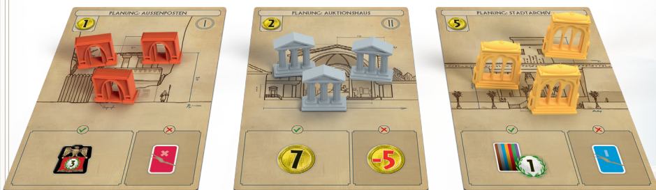
Spielvorbereitung im Spiel zu fünft