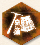
Abenteuerkarte und -marker

Die Abenteuer mit Eigenschaft KOSMISCHE KONSTELLATION werden nur benutzt, wenn zu Spielbeginn die Prologkarte „Die kosmische Konstellation“ gezogen wurde. Wie auf der Prologkarte angegeben, legt man alle Abenteuerkarten beiseite. Die Abenteuer mit Eigenschaft KOSMISCHE KONSTELLATION sind in vier Phasen unterteilt, die hinter der Eigenschaft auf der Kartenvorderseite stehen ( I, II, III, IV ).